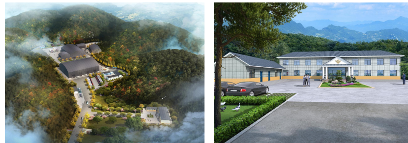
主要经济技术指标