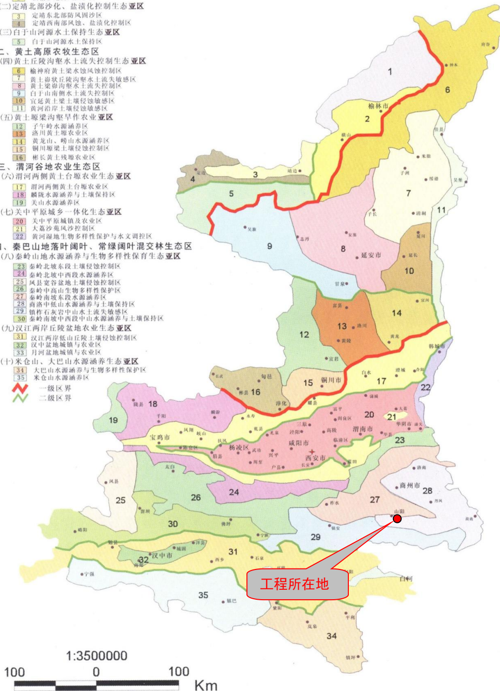
图 3-1 陕西省生态功能区划图