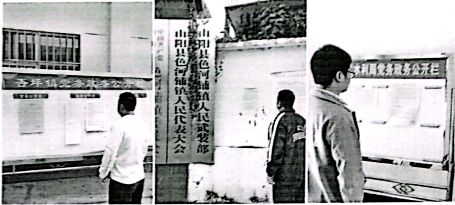
图 3-2 现场张贴照片

在此期间，商洛市水利局于 2023 年 8 月 2 日在规划范围内的杏坪镇政府、色河铺镇以及商洛市水利局本单位公告栏进行了环境影响评价第二次信息现场张贴，照片如下：